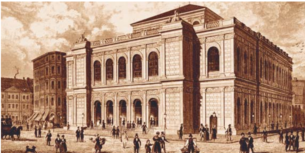
Hamburger Börse um 1840