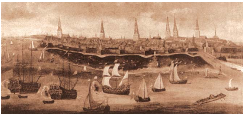
Hamburg um 1600

Kurze Zeit später wurden die ausländischen Händler den Hamburger Bürgern sogar gleichgestellt – Hamburg betrieb eine recht pragmatische Politik.