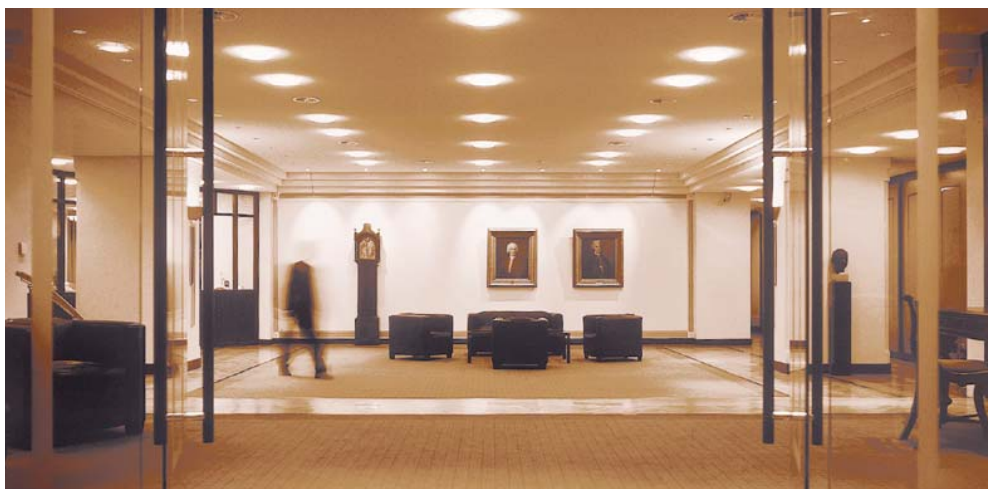
Kassenhalle in Hamburg, Neuer Jungfernstieg

Heute ist die Berenberg Bank eine dynamische und moderne Privatbank mit 850 Mitarbeitern in Hamburg, Bielefeld, Bremen, Düsseldorf, Frankfurt, München, Stuttgart, Wiesbaden, London, Luxemburg, Mailand, Paris, Salzburg, Shanghai und Zürich. Sie ist im Private Banking, Investment Banking, Institutionellen Asset Management und Commercial Banking tätig.