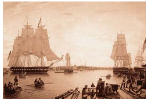
Der Hafen von Boston um 1840