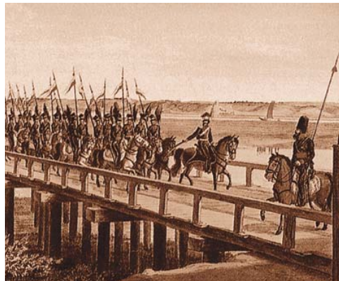
Napoleonische Truppen besetzen Hamburg.